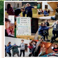
Konfi-Wochenende der Reuschkonfis in Röttenbach