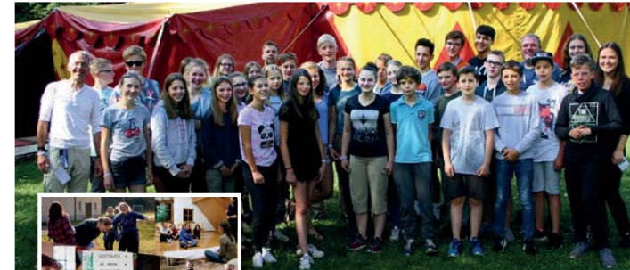
Die Konfigruppe am Anfang der Konfizeit in Röttenbach mit Jugendmitarbeiter*innen

Die Konfirmationen für die Jugendlichen aus der Reuschgemeinde finden am 12.07.20, 04.10.20 und 11.10.20 jeweils für 3-4 Konfirmandinnen und Konfirmanden in der Reuschkirche statt.